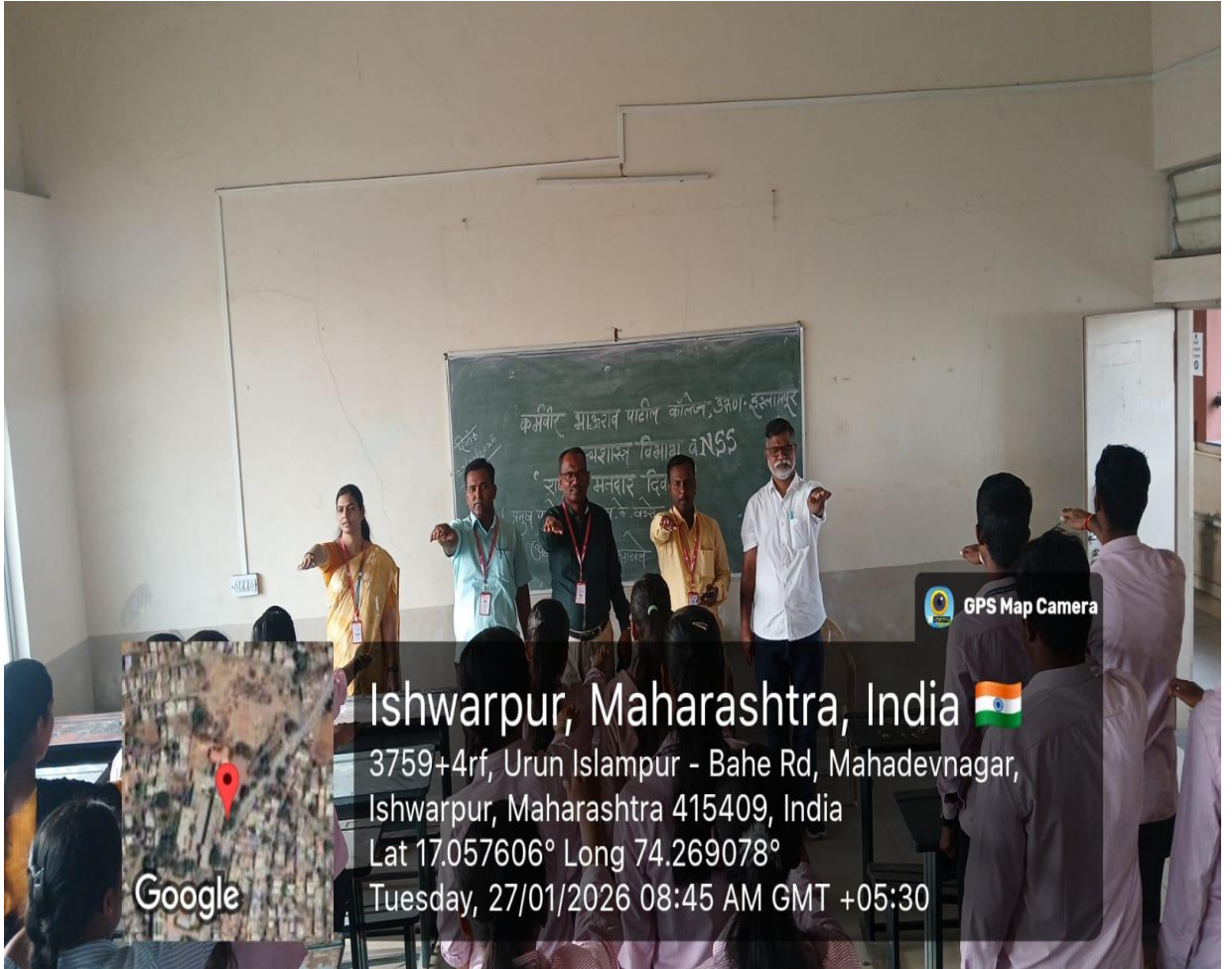
मतदानाचा हक्क बजाविण्याची शपथ घेताना उपस्थित मान्यवर व विद्यार्थी