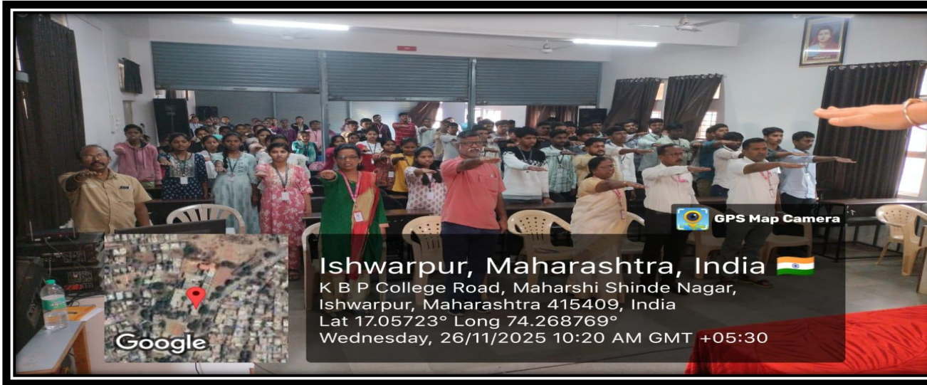
भारतीय संविधानाच्या उद्देशिकेची शपथ घेताना उपस्थित मान्यवर