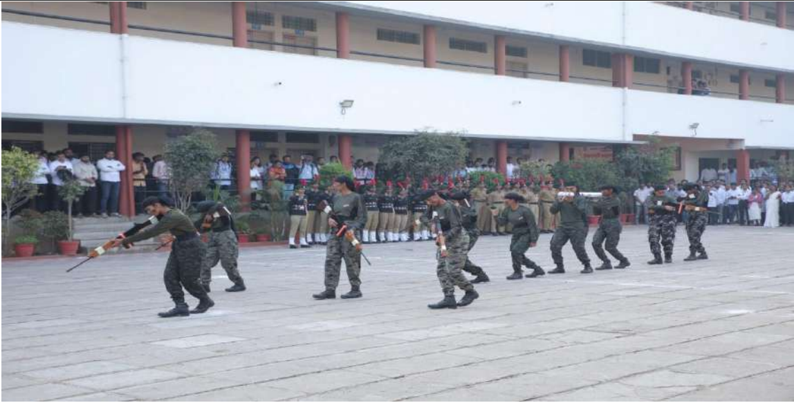
प्रजासत्ताकदिनी प्रसंगी एन. सी. सी. च्या विद्यार्थीनी सायलेंट डेमोचे सादरीकरण करताना