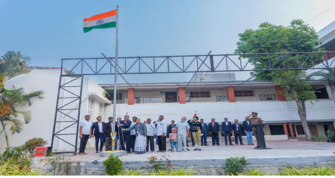
प्रजासत्ताकदिनी ध्वजारोहण करताना मान्यवर